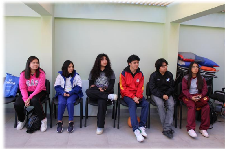
Consejo Consultivo de Adolescentes y Jóvenes de Taltal