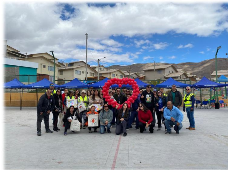
Planificación intersectorial, en torno a efemérides de salud.