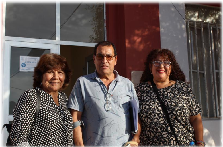
Consejo de Desarrollo Local (CDL)