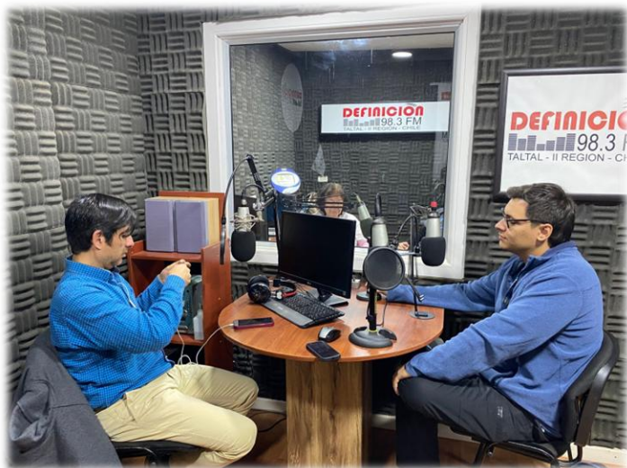
Comunicación en Radio Definición FM